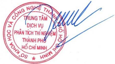
Đoàn Thị Bội Hanh

1/ KẾT QUẢ NÀY CHỈ CÓ GIÁ TRỊ TRÊN MẪU THỬ/ THIS RESULT IS ONLY VALID ON TESTED SAMPLE. 2/ Thông tin về mẫu được ghi theo yêu cầu của khách hàng/ The sample information is written as customer's request. 3/ Không được sao chép toàn bộ hoặc một phần kết quả này dưới bất kỳ hình thức nào nếu không được sự đồng ý bằng văn bản của CASE/ No fully or partial of this result may be reproduced in any form without prior permission in writing from CASE.