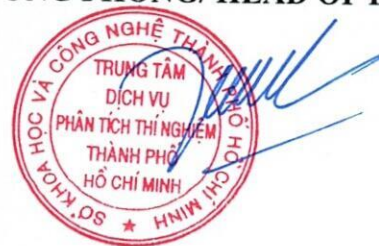
Đoàn Thị Bội Hanh

1/ KẾT QUẢ NÀY CHỈ CÓ GIÁ TRỊ TRÊN MẪU THỬ/THIS RESULT IS ONLY VALID ON TESTED SAMPLE. 2/Thông tin về mẫu được ghi theo yêu cầu của khách hàng/The sample information is written as customer's request. 3/ Không được sao chép toàn bộ hoặc một phần kết quả này dưới bất kỳ hình thức nào nếu không được sự đồng ý bằng văn bản của CASE/ No fully or partial of this result may be reproduced in any form without prior permission in writing from CASE.