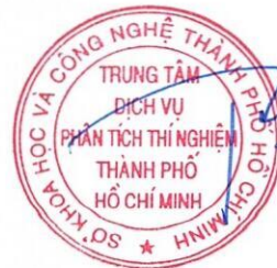
Phái Minh Loan

1/ KẾT QUẢ NÀY CHỈ CÓ GIÁ TRỊ TRÊN MẪU THỬ/THIS RESULT IS ONLY VALID ON TESTED SAMPLE. 2/ Thông tin về mẫu được ghi theo yêu cầu của khách hàng/The sample information is written as customer's request. 3/ Không được sao chép toàn bộ hoặc một phần kết quả này dưới bất kỳ hình thức nào nếu không được sự đồng ý bằng văn bản của CASE/ No fully or partial of this result may be reproduced in any form without prior permission in writing from CASE.