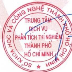
Phú Minh Tuấn

1/ KẾT QUẢ NÀY CHỈ CÓ GIÁ TRỊ TRÊN MẪU THỬ/ THIS RESULT IS ONLY VALID ON TESTED SAMPLE. 2/ Thông tin về mẫu được ghi theo yêu cầu của khách hàng/ The sample information is written as customer's request. 3/ Không được sao chép toàn bộ hoặc một phần kết quả này dưới bất kỳ hình thức nào nếu không được sự đồng ý bằng văn bản của CASE/ No fully or partial of this result may be reproduced in any form without prior permission in writing from CASE.