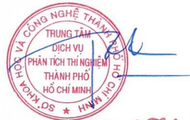
Phú Minh Tuấn

1/ KẾT QUẢ NÀY CHỈ CÓ GIÁ TRỊ TRÊN MẪU THỬ/THIS RESULT IS ONLY VALID ON TESTED SAMPLE. 2/ Thông tin về mẫu được ghi theo yêu cầu của khách hàng/The sample information is written as customer's request. 3/ Không được sao chép toàn bộ hoặc một phần kết quả này dưới bất kỳ hình thức nào nếu không được sự đồng ý bằng văn bản của CASE/ No fully or partial of this result may be reproduced in any form without prior permission in writing from CASE.