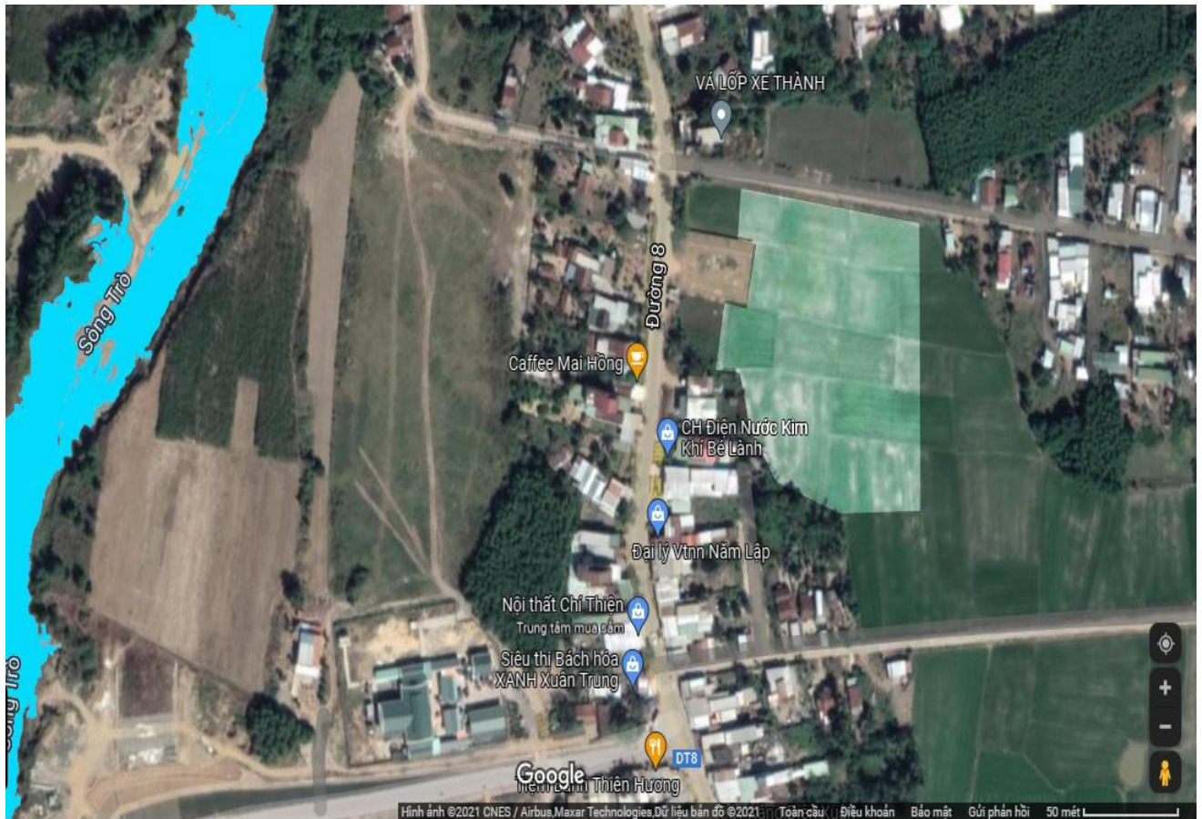
Hình 1. Vị trí thực hiện dự án

- Mục tiêu đầu tư: Đạt tiêu chí xây dựng nông thôn mới, công nhận đạt trường chuẩn quốc gia, đảm bảo đủ điều kiện dạy và học cho các cháu học sinh.